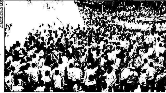
ಗೋಕಾಕ ನಗರದಲ್ಲಿ ರಮೇಶ ಜಾರಕಿಹೊಳೆ ಬೆಂಬಲಿಗರು ಬೃಹತ್ ಪ್ರತಿಭಟನೆ ನಡೆಸಿದರು.

ಜಾರಕಿಹೊಳೆ ಪರ ಪಾಲಕರು ಶಿವಕುಮಾರ್ ಪರ ಯುವತಿ: ಆಡುಗೋಡಿಯ ಟೆಕ್ನಿಕಲ್ ಸೆಂಟರ್‌ನಲ್ಲಿ ಶನಿವಾರ ಎಸ್‌ಐಟಿ ವಿಚಾರಣೆ ಎದುರಿಸಿ ಸುದ್ದಿಗಾರರೊಂದಿಗೆ ಮಾತನಾಡಿದ ಯುವತಿ ಪಾಲಕರು, ಕೆಪಿಸಿಸಿ ಅಧ್ಯಕ್ಷ ಡಿ.ಕೆ.ಶಿವಕುಮಾರ್ ವಿರುದ್ಧ ನೇರವಾಗಿ ಆರೋಪ ಮಾಡಿದ್ದಾರೆ. ಸಿಡಿ ಲೇಡಿ ಮಾತ್ರ ರಮೇಶ್ ಜಾರಕಿಹೊಳೆ ವಿರುದ್ಧ ಆರೋಪಿಸುತ್ತಿದ್ದಾರೆ. 'ಇದಕ್ಕೆಲ್ಲ ಡಿ.ಕೆ.ಶಿವಕುಮಾರ್ ಕಾರಣ. ಪ್ರಕರಣ ಬೆಳಕಿಗೆ ಬಂದ ಕೂಡಲೇ ಯುವತಿಗೆ ಹಣ ಕೊಟ್ಟು ಗೋವಾಕ್ಕೆ ಕಳುಹಿಸಿದ್ದಾರೆ' ಎಂದು ಯುವತಿ ಪಾಲಕರು ಡಿಕೆಶಿ ವಿರುದ್ಧ ಆಕ್ರೋಶ ಹೊರ ಹಾಕಿದ್ದರು. ಇದಾದ ಕೆಲವೇ ನಿಮಿಷಗಳಲ್ಲಿ ಅಜ್ಞಾತ ಸ್ಥಳದಿಂದ ವಿದಿಯೋ ಹರಿಬಿಟ್ಟ ಯುವತಿ, 'ಪಾಲಕರಿಗೆ ಎನೂ ತಿಳಿದಿಲ್ಲ. ಸ್ವ-ಇಚ್ಛೆಯಿಂದ ಹೀಗೆ ಹೇಳಲು ಸಾಧ್ಯವಿಲ್ಲ. ಅವರನ್ನು ಬೆದರಿಸಿ ಈ ರೀತಿ ಹೇಳಿಸಿದ್ದಾರೆ' ಎಂದು ಡಿಕೆಶಿ ವಿರುದ್ಧದ ಆರೋಪದವನ್ನು ತಳ್ಳಿ ಹಾಕಿದ್ದಾರೆ. ಪಾಲಕರು ಹಾಗೂ ಯುವತಿ ನೀಡಿರುವ ಹೇಳಿಕೆಯಿಂದ ತನಿಖಾಧಿಕಾರಿಗಳಲ್ಲಿ ಗೊಂದಲ ಇನ್ನಷ್ಟು ಹೆಚ್ಚಾಗಿದೆ.