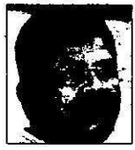
ಲಾಕ್‌ಡೌನ್ ಜಾರಿಗೊಳಿಸಲಾಗುತ್ತದೆ ಎಂಬ ವದಂತಿಗಳಿಗೆ ರಾಜ್ಯ ಸರ್ಕಾರ ತೆರೆ ಎಳೆದಿದೆ.

ಗುರುವಾರ ವಿಧಾನಸೌಧದಲ್ಲಿ ಮುಖ್ಯ ಮಂತ್ರಿ ಬಿ.ಎಸ್.ಯಡಿಯೂರಪ್ಪ ನೇತೃತ್ವದಲ್ಲಿ ಕೋವಿಡ್ ನಿಯಂತ್ರಣ ಹಿನ್ನೆಲೆಯಲ್ಲಿ ನಡೆದ ತುರ್ತು ಸಭೆಯ ಬಳಿಕ ಸುದ್ದಿಗಾರರ ಜತೆ ಮಾತನಾಡಿದ ಅವರು, ಲಾಕ್‌ಡೌನ್ ಜಾರಿಗೊಳಿಸಿದರೆ ಶ್ರಮಿಕ ವರ್ಗಕ್ಕೆ ಮತ್ತಷ್ಟು ತೊಂದರೆಯಾಗುವ ಸಾಧ್ಯತೆ ಇದೆ. 6