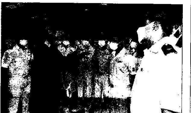
ನೌಕಾಪಡೆಯ ಮುಖ್ಯಸ್ಥ ಅಡ್ಮಿರಲ್ ಕರಂಬೀರ್ ಸಿಂಗ್ ಅವರು ಕಾರವಾರದ ನೌಕಾ ನೆಲೆಗೆ ಗುರುವಾರ ಭೇಟಿ ನೀಡಿ ಸಿದ್ಧತಾ ಪರಿಶೀಲನೆ ನಡೆಸಿದರು.

ಈ ಮಧ್ಯೆ ವಿಧಾನಪರಿಷತ್‌ನಲ್ಲಿ ಅಂಗೀಕಾರವಾಗದ ಕಾರಣ 'ಕರ್ನಾಟಕ ಭೂ ಸುಧಾರಣೆಗಳ (ಎರಡನೇ ತಿದ್ದುಪಡಿ) ವಿಧೇಯಕ, 2020'ಕ್ಕೆ ಎರಡನೇ ಬಾರಿಗೆ ಸುಗ್ರೀವಾಚ್ಛೆ ಹೊರಡಿಸಲು ಸಂಪುಟ ಅನುಮೋದನೆ ನೀಡಿದೆ. ಹವಾಮಾನ ಮುನ್ಸೂಚನೆ: ಮತ್ತೊಂದು ಮಹತ್ವದ ನಿರ್ಣಯದಲ್ಲಿ ರಾಷ್ಟ್ರೀಯ ಚಂಡಮಾರುತ ಅಪಾಯ ತಡೆಗಟ್ಟುವ ಯೋಜನೆಯಡಿ ಕರಾವಳಿಯ ಮೂರು ಜಿಲ್ಲೆಗಳಿಗೆ ಹವಾಮಾನ ಮುನ್ಸೂಚನೆ ಪದ್ಧತಿ ಅನುಷ್ಠಾನಗೊಳಿಸುವ 26.92 ಕೋಟಿ ರೂ. ಮೊತ್ತದ ಯೋಜನೆಗೆ ಸಚಿವ ಸಂಪುಟ ಒಪ್ಪಿಗೆ ನೀಡಿದೆ.