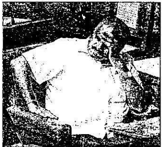
ಚಿಂತಾಕ್ರಾಂತ ಸಿಎಂ ಕುಮಾರಸ್ವಾಮಿ.