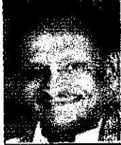
ಎಂಟಿಬಿ ನಾಗರಾಜ್ ಪೌರಾಡಳಿತ ಹಾಗೂ ಸಕ್ಕರೆ