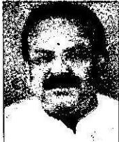
ಅರವಿಂದ ಲಿಂಬಾವಳಿ ಅರಣ್ಯ, ಕನ್ನಡ ಮತ್ತು ಸಂಸ್ಕೃತಿ ಇಲಾಖೆ

ಸಣ್ಣ ನೀರಾವರಿ ಖಾತೆಯನ್ನು ಹಿಂಪಡೆದಿದ್ದರಿಂದ ಮುನಿಸಿಕೊಂಡಿದ್ದ ಜಿ.ಸಿ.ಮಾಧುಸ್ವಾಮಿಗೆ ಹೆಚ್ಚುವರಿಗೆ ಹೆಚ್ ಮತ್ತು ವಕ್ಫ್ ಖಾತೆಯನ್ನು ನೀಡಲಾಗಿದೆ. ಅಬಕಾರಿ ಖಾತೆ ಬೇಡ ಎಂದು ಪಟ್ಟು ಹಿಡಿದಿದ್ದ ಎಂಟಿಬಿ ಪೌರಾಡಳಿತ ಹಾಗೂ ಸಕ್ಕರೆ ಖಾತೆ ಜವಾಬ್ದಾರಿ ಕೊಡಲಾಗಿದೆ. ಆರ್.ಶಂಕರ್‌ಗೆ ತೋಟಗಾರಿಕೆ ಜೊತೆಗೆ ರೇಷ್ಮೆ ಹಾಗೂ ಕೆ.ಸಿ. ನಾರಾಯಣಗೌಡ ಅವರಿಗೆ ಹೆಚ್ಚುವರಿಗೆಯಾಗಿ ಯೋಜನೆ ಕಾರ್ಯಕ್ರಮ, ಉಸ್ತುವಾರಿ ಹಾಗೂ ಅಂಕಿಸಂಖ್ಯೆ ಖಾತೆಗಳನ್ನು ನೀಡಲಾಗಿದೆ. ಆಹಾರ ಖಾತೆ ಹಿಂಪಡೆದಿದ್ದರಿಂದ ಮುನಿಸಿಕೊಂಡಿದ್ದ ಗೋಪಾಲ್‌ಯ್ಯ ಅವರಿಗೆ ಅಬಕಾರಿ ಖಾತೆ ನೀಡಲಾಗಿದೆ.