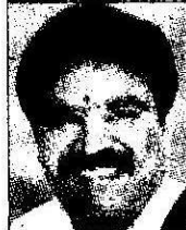
ಆರ್ ಶಂಕರ್ ತೋಟಗಾರಿಕೆ ಮತ್ತು ರೇಷ್ಮೆ