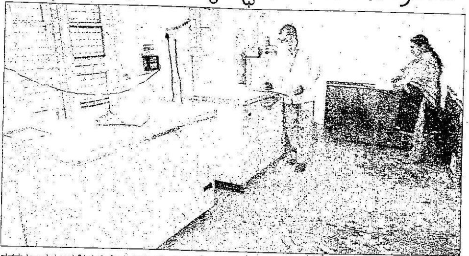
ನಗರದ ದಾಸಪ್ಪ ಆಸ್ಪತ್ರೆಯಲ್ಲಿ ಕೋಲ್ಡ್ ಸ್ಟೋರೇಜ್ ವ್ಯವಸ್ಥೆಯಿರುವುದರಿಂದ ಕೋವಿಡ್ ಲಸಿಕೆ ಸಂಗ್ರಹಕ್ಕೆ ಸಿದ್ಧತೆ ನಡೆದಿದೆ.