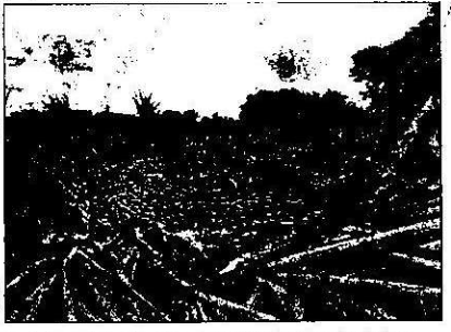
ಬಸವನಗರ ಜಲಾಶಯದಿಂದ ನೀರನ್ನು ಬುಧವಾರ ಕೃಷ್ಣಾ ನದಿಗೆ ಬಿಡಲಾಗಿದೆ (ಎಡ ಚಿತ್ರ). ಬೀದರ್ ನಲ್ಲಿ ನೆಲಕೊರೆದ ಕಬ್ಬು.

ಬೆಳಗಾವಿ ವಿಮಾನ ನಿಲ್ದಾಣದಲ್ಲಿ ಅಧಿಕ ಮಳೆ ಗುರುವಾರ ಬೆಳಗಾವಿ ವಿಮಾನ ನಿಲ್ದಾಣದಲ್ಲಿ ಅತಿ ಹೆಚ್ಚು 170 ಮಿ. ಮೀ. ನಷ್ಟು ಮಳೆಯಾಗಿದೆ. ಗುಬ್ಬಿ 100, ಚಿತ್ತಾಪುರ 90, ಆನೇಕಲ್, ಕೆ. ಆರ್.ನಗರ, ಕಂಪ್ಲಿ, ಕುಡ್ಲಿ, ಕುಡ್ಲಿ, ಕುಮಕೂರಿನಲ್ಲಿ 70 ಮಿ.ಮೀ. ಮಳೆಯಾಗಿದೆ. ಮಂಗಳೂರಿನಲ್ಲಿ ಗುರುವಾರ ಸಂಜೆ ಸುರಿದ ಮಳೆಗೆ ಆನೇಕ ಕಡೆ ನೆರೆ ಉಂಟಾಗಿತ್ತು.