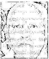
ಗೋವತ್ಸೆ ಮಸೂದೆ ಜಾರಿಗೆ ತರಲಾಗುವುದು. • ಬಿ.ಎಸ್.ಯಡಿಯೂರಪ್ಪ, ಮುಖ್ಯಮಂತ್ರಿ.

ಲಿದ್ದು ಪ್ರತಿಪಕ್ಷ ಮಸೂದೆಗಳ ಮಂಡನೆಯಾಗಲಿದ್ದು, ಇದು ಧನ ಪ್ರಶೋತ್ತರ ಕಲಾಪ ಇರಲಿವೆ. ಕೊನೆಯ ಎರಡು ದಿನ ಒಂದು ದಿನ ಒಂದು ಚುನಾವಣೆ ಕುರಿತು ಚರ್ಚೆ ನಡೆಯಲಿವೆ.