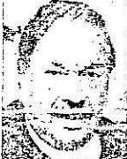
ಸಂವಿಧಾನ ಸಂಶೋಧನಾ ಕಮಿಷನ್ ವಹಿಸಲಾಗುವುದು ಎಂದರು.

ಧರ್ಮಶಾಸ್ತ್ರ ಸಂಸ್ಥೆಗೆ ದಾನವ್ಯಾಪ್ತರಾಗಿ ಗ್ರಾಮೀಣ ಪ್ರದೇಶದ ಕುಡಿಯುವ ನೀರು ಶುದ್ಧೀಕರಣ ಘಟಕಗಳ ಅನುಷ್ಠಾನ ಮತ್ತು ನಿರ್ವಹಣೆಯನ್ನು ಧರ್ಮಶಾಸ್ತ್ರ ಗ್ರಾಮೀಣಾಭಿವೃದ್ಧಿ ಸಂಸ್ಥೆಗೆ ಹಸ್ತಾಂತರಿಸಲು ಸರ್ಕಾರ ಸಿದ್ಧವಿದ್ದು, ಅಗತ್ಯವಿದ್ದರೆ ಈ ಕುರಿತು ಧರ್ಮಶಾಸ್ತ್ರ ಧರ್ಮಾಧಿಕಾರಿ ಜಲ ಮಾತುಕತೆ ನಡವಲು ಬಿಡುವೆಂದು ಸಚಿವ ಈಶ್ವರಪ್ಪ ಭರವಸೆ ನೀಡಿದರು. ಸಲಹೆಗಲ ತಾಲೂಕಿನಲ್ಲಿ ಈ ಪ್ರಯೋಗ ಉಪಕ್ರಮಗಳನ್ನು ಪ್ರಸ್ತಾಪಿಸಿದ ಅಬ್ಬಾಣಿವೆ, ಭಾಸಕರ ಅನುಷ್ಠಾನ ಉಪಕ್ರಮ ಎಂದು ಈ ಸಂಸ್ಥೆಗೆ ಶೇ.ಒಟ್ಟು 15 ವರ್ಷಗಳ ತನಕ ನಿರ್ವಹಣೆ ಸುಧಿಸಿ ಮಾಡಿಕೊಳ್ಳುವುದು ಎಂದರು. ಈ ಮಾತಿಗೆ ಸ್ವಾಗತಿಸಿದ ಸಚಿವರು, ಎಲ್ಲ ಶಾಸಕರು ಒಪ್ಪಿದರೆ ಧರ್ಮಶಾಸ್ತ್ರ ಗ್ರಾಮೀಣಾಭಿವೃದ್ಧಿ ಜನ ಒಡ್ಡುವ ಮಾಡಿಕೊಳ್ಳಲಾಗುವುದು ಎಂದರು.