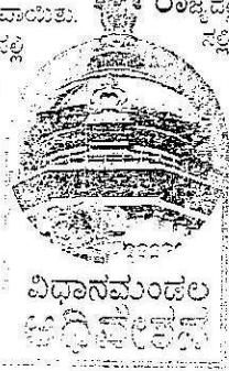
ವಿಧಾನಮಂಡಲ ಶಿವಮೊಗ್ಗ ಜಿಲ್ಲಾ ಪತ್ರಿಕೆ

ಪತ್ರಿಕೋದ್ಯಮದಲ್ಲಿ 25 ವರ್ಷ ಸೇವೆ ಪೂರ್ಣಗೊಳಿಸಿ ವಾರ್ಷಿಕ 1.2 ಲಕ್ಷ ರೂ. ಆದಾಯ ಮತ್ತು 2 ಲಕ್ಷ ರೂ. ಗಿಂತ ಕಡಿಮೆ ಉಪದಾನವಿರುವ ಹಿರಿಯ ಪತ್ರಕರ್ತರಿಗೆ ಮಾಸಾತನ ನೀಡಲಾಗುತ್ತಿದೆ. ಅದೇ ರೀತಿ ಪತ್ರಕರ್ತರು ಮಕ್ಕಳಾದಲ್ಲಿ, ಅವರ ಅವಲಂಬಿತ ಪತ್ನಿ ಅಥವಾ ಪತಿಗೆ 3 ಸಾವಿರ ರೂ. ಮಾಸಾತನ ನೀಡಲಾಗುತ್ತಿದೆ. ಸದ್ಯ ಸಂಕಷ್ಟದಲ್ಲಿರುವ 250 ಪತ್ರಕರ್ತರು ಮತ್ತು 16 ಮಂದಿ ಕುಟುಂಬದವರಿಗೆ ಮಾಸಾತನ ನೀಡಲಾಗುತ್ತಿದೆ. ಪತ್ರಿಕೋದ್ಯಮದಲ್ಲಿ ಸೇವೆ ಸಲ್ಲಿಸುವ ಎಲ್ಲ ಪತ್ರಕರ್ತರಿಗೂ ಈ ಸವಲತ್ತು ವಿನ್ಯಾಸವನ್ನು ಕುರಿತು ಪರಿಶೀಲಿಸಲಾಗುವುದು ಎಂದು ಹೇಳಿದ್ದಾರೆ.