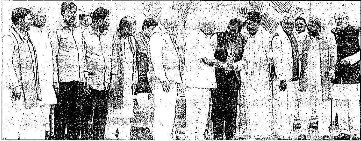
ನೂತನ ಸಚಿವರ ಪ್ರಮಾಣ ವಚನ ಸ್ವೀಕಾರ ಸಮಾರಂಭ ರಾಜಭವನದಲ್ಲಿ ಗುರುವಾರ ನಡೆಯಿತು.

ಕಾಂಗ್ರೆಸ್ ಶಾಸಕ ಡಿ.ಕೆ. ಶಿವಕುಮಾರ್‌ಗೆ ಸಡ್ಡು ಹೊಡೆಯುವ