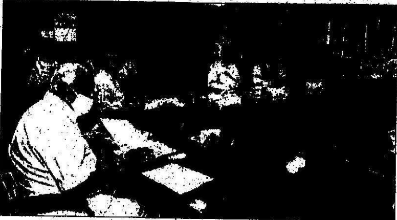
ಕೃಷ್ಣಾದಲ್ಲಿ ಗೃಹ ಇಲಾಖೆಯ ಪ್ರಗತಿ ಪರಿಶೀಲನಾ ಸಭೆ ನಡೆಯಿತು.

ಈ ಬಗ್ಗೆ ಗುರುವಾರ ಮುಖ್ಯ ಮಂತ್ರಿಗಳ ಅಧಿಕೃತ ನಿವಾಸ ಕೃಷ್ಣಾದಲ್ಲಿ ನಡೆದ ಗೃಹ ಇಲಾಖೆ ಪ್ರಗತಿ ಪರಿಶೀಲನಾ ಸಭೆಯಲ್ಲಿ ಮುಖ್ಯಮಂತ್ರಿ ಯಡಿಯೂರಪ್ಪ ಅವರು ಚರ್ಚಿಸಿ ಈ ನಿರ್ಧಾರಕ್ಕೆ ಬರಲಾಗಿದೆ. ಕೆಲಸ ಕಳೆದುಕೊಳ್ಳುವ ಭೀತಿಯಲ್ಲಿರುವ ಮೂರು ಸಾವಿರಕ್ಕೂ ಹೆಚ್ಚು ಹೋಂ ಗಾರ್ಡ್‌ಗಳನ್ನು ಸೇವೆಯಿಂದ ತೆಗೆದಿರುವ ವಿವಿಧ ಇಲಾಖೆಗಳಿಗೆ ನಿರೋಧಿಸಲು ದುಡಿದವರನ್ನು ತೆಗೆದುಕೊಳ್ಳುವ ನಿರೀಕ್ಷೆಯನ್ನು ಸರ್ಕಾರವು ಬಿಡಿಸುವ ಕುರಿತು ಕ್ರಮದ ಬಗ್ಗೆ ಪರಾಮರ್ಶೆ ನಡೆಸುವಂತೆ ಸೂಚನೆ ನೀಡಿದ್ದಾರೆ.