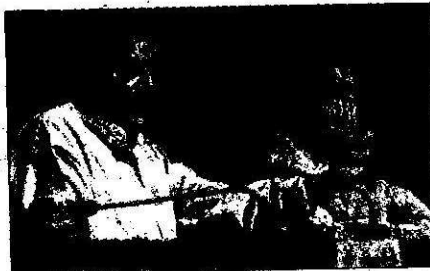
ಕೇಂದ್ರ ಸಂಪುಟ ಸಭೆ ವಿವರ ಪ್ರಕಟಿಸಿದ ಸಚಿವರಾದ ಜಿತೇಂದ್ರ ಸಿಂಗ್, ಪ್ರಕಾಶ್ ಜಾವಡೇಕರ್.

'ಹಿಂದಿನ ಸಂಪುಟ ಸಭೆಯಲ್ಲಿ ರಾಷ್ಟ್ರವ್ಯಾಪಿ ಏಕರೂಪದ ನೇಮಕಾತಿ ಆಯೋಗದ ರಚನೆಯ ಬಗ್ಗೆ ನಿರ್ಧಾರ ಕೈಗೊಳ್ಳಲಾಗಿತ್ತು. ಈ ಬಾರಿಯ ಸಭೆಯಲ್ಲಿ ನೇಮಕಾತಿಯಾದವರ ದಕ್ಷತೆಯನ್ನು ಹೆಚ್ಚಿಸುವ ಬಗ್ಗೆ ನಿರ್ಧಾರ ಕೈಗೊಳ್ಳಲಾಗಿದೆ. ಮಿಷನ್ ಕರ್ಮಯೋಗಿಯಿಂದ ದೇಶದ ನಾಗರಿಕ ಸೇವೆಗಳಲ್ಲಿನ ಸರ್ಕಾರಿ ನೌಕರರು ಅತ್ಯುತ್ತಮ ಮಟ್ಟದ ಸೇವೆಯನ್ನು ಸಲ್ಲಿಸುವಂತೆ ಮಾಡುವುದು ಇದರ ಮುಖ್ಯ ಉದ್ದೇಶವೆಂದು ಸಚಿವರು ಹೇಳಿದರು. ಈ ಯೋಜನೆಯಡಿ ರೇಷಿಂಗು ಹೇಗಿರಬೇಕು, ಅವುಗಳನ್ನು ಯಾವ ರೀತಿಯಲ್ಲಿ ಪರಿಣಾಮಕಾರಿಯಾಗಿ ಅನುಷ್ಠಾನಗೊಳಿಸಬೇಕೆಂದು