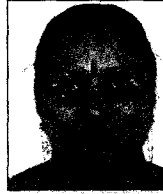
ಆಯೋಗಕ್ಕೆ ನಾವು ಮನವಿ ಮಾಡಿಲ್ಲ. ಆ ಅಧಿಕಾರ ವ್ಯಾಪ್ತಿ ನಮಗಿಲ್ಲ.