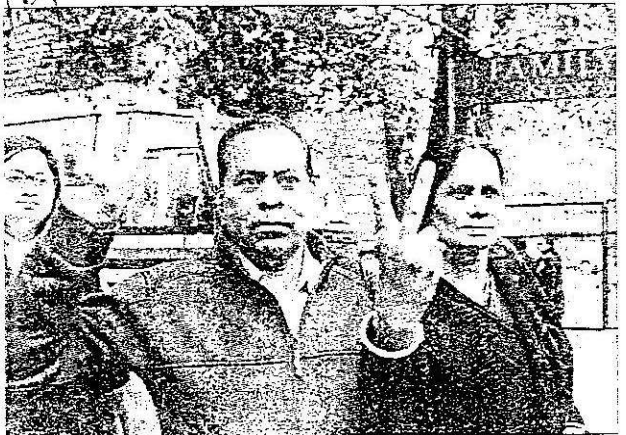
ಸುಪ್ರೀಂ ತೀರ್ಪಿನ ಬಳಿಕ ವಿಜಯದ ಸಂಕೇತ ತೋರಿದ ನಿರ್ಭಯಾ ಪಾಲಕರು.