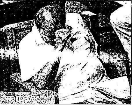
ವಿಶ್ವಾಸಮತ ಯಾಚನೆ ಬಳಿಕ ವಿಧಾನಸಭೆಯಲ್ಲಿ ಸಿಎಂ ಕುಮಾರಸ್ವಾಮಿ ಅವರ ಒಂದು ಭಂಗಿ..

ವಿಶ್ವಾಸಮತ ಪ್ರಕ್ರಿಯೆಗೆ ಅಡ್ಡಿಯಾದ ಕಾರಣಿಗಳನ್ನು ಕ್ರಿಯಾಲೋಕಿಸಿ ಬಿಡಿಸಿ ಬಿಡಿಸಿ ಗುರುವಾರವೇ ಪ್ರಕ್ರಿಯೆ ಪೂರ್ಣಗೊಳಿಸಬೇಕೆಂಬ ರಾಜ್ಯಪಾಲರ ಸಂದೇಶಕ್ಕೆ ದೋಷಿ ಅಕ್ಷೇಷ ಬಿಜೆಪಿಯಿಂದ ವಿಧಾನಸಭೆಯಲ್ಲಿ ರಾತ್ರಿ ಧರಣಿ, ರಾಜ್ಯಪಾಲರಿಂದ ಸಿಎಂಗೆ ಬಂತು ಅದೇಕೆ