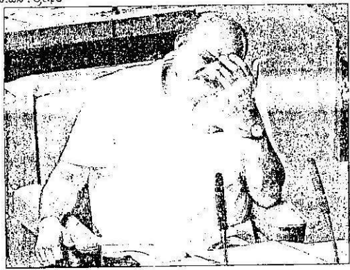
ಸರ್ಕಾರ ಉಳಿಯುವುದೋ, ಉರುಳುವುದೋ... ಸದನದಲ್ಲಿ ಮುಖ್ಯಮಂತ್ರಿ ಎಚ್.ಡಿ. ಕುಮಾರಸ್ವಾಮಿ ಚಿಂತನೆ.

ಪ್ರತಿಪಕ್ಷ ನಾಯಕ ಬಿ.ಎಸ್. ಯಡಿಯೂರಪ್ಪ ಅವರ ಅಭಿಪ್ರಾಯ ಕೇಳಿ ದಿನಾಂಕ ಗೊತ್ತುಪಡಿಸಲು ಬಯಸಿದ ಸ್ಪೀಕರ್, ಸಭೆಗೆ ಮತ್ತೊಮ್ಮೆ ಆಹ್ವಾನಿಸಿ ಕೇಳಿ ಸಿಬ್ಬಂದಿಯನ್ನು ಕಳಿಸಿದರು. ಎಲ್ಲವೂ ಮುಗಿದುಹೋಗಿರುವಾಗ ಯಾವ ಕಲಾಪ ನಡೆಸುವ ಅಗತ್ಯವಿಲ್ಲ ಮತ್ತು ಸಮಿತಿ ಸಭೆ ನಡೆಸುವುದು ಅಪ್ರಸ್ತುತ ಎಂದು ಪ್ರತಿಪಕ್ಷ ನಾಯಕರು ಸಂದೇಶ ಕಳಿಸಿ ಗೃಹ ವಾಜಲಾದರು. ಆದರೂ, ಪ್ರತಿಪಕ್ಷ ನಾಯಕ ರನ್ನು ಮತ್ತೊಮ್ಮೆ ಸಂವರ್ಧನ ಪ್ರಯತ್ನ ಮಾಡಿ ಸದನದಲ್ಲಿ ವಿಶ್ವಾಸಮತ ಯಾಚನೆಗೆ ದಿನಾಂಕ ಗೊತ್ತುಪಡಿಸುವುದಾಗಿ ಸ್ಪೀಕರ್ ಭರವಸೆ ನೀಡಿದರು ಎಂದು ತಿಳಿದುಬಂದಿದೆ.