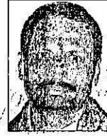
ಅಶಕರು ಪ್ರೇರಣೆಗೊಂಡು ರಾಜೀನಾಮೆ ನೀಡಿದ್ದಾರೆ," ಎಂದು.

ಹುಬ್ಬಳ್ಳಿ: ಆಡಿಯೋ ಮಾಡಿಸುವುದರಲ್ಲಿ ಮಾಜಿ ಸಿಎಂ ಸಿದ್ದರಾಮಯ್ಯ ನಿರೀಕ್ಷಿಸಿರುವ ವಿಷಯ ಉಪ ಮುಖ್ಯಮಂತ್ರಿ ಲಕ್ಷ್ಮಣ ಸವದಿ ಆರೋಪಿಸಿದರು. ಸುದ್ದಿಗಾರರ ಜತೆ ಮಾತನಾಡಿ, "ಧರ್ಮಸ್ಥಳದ ಶಾಂತಿವನದಲ್ಲಿ ವ್ಯಕ್ತಿ ಸರಕಾರ ಬೀಳಲಿದೆ ಎಂದು ಸಿದ್ದರಾಮಯ್ಯನವರೇ ತಪ್ಪುಮಾತನು ಆಡಿಯೋ ರಿಕಾರ್ಡ್‌ಗಳಿಗೆ ಮಾಡಿಸಿದ್ದರು. ಅದು ವೈರಲ್ ಕೂಡ ಆಗಿತ್ತು. ಈ ಹೇಳಿಕೆಯಿಂದಲೇ ಕಾಂಗ್ರೆಸ್ ನ