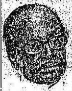
ಹೋಗುವುದಿಲ್ಲ. ಅವರು ಏನು ಹೇಳುತ್ತಾರೆ ನೋಡೋಣ, ಮರುದಿನ ನಾನು ಮಾತನಾಡುತ್ತೇನೆ."

ಮಂಗಳೂರು: "ಮಾಜಿ ಸಿಎಂ ಸಿದ್ದರಾಮಯ್ಯ ಕಾಂಗ್ರೆಸ್ ಪಕ್ಷವನ್ನು ಮುಗಿಸಿಯೇ ಹೋಗುತ್ತಾರೆ," ಎಂದು ಕಾಂಗ್ರೆಸ್ ಓರಿಯಂಟಲ್ ನಾಯಕ, ಕೇಂದ್ರ ಮಾಜಿ ಸಚಿವ ಜನಾರ್ದನ ಪೂಜಾರಿ ಹೇಳಿದರು. ಮಂಗಳವಾರ ಪ್ರತಿ ಕಾಂಗ್ರೆಸ್ಸಿಯರಲ್ಲಿ ಮಾತನಾಡಿ, "ಸಿದ್ದರಾಮಯ್ಯಗೆ ಹೆಚ್ಚು ಅಧಿಕಾರ ಕೊಡುವುದೇ ತಪ್ಪು. ನನ್ನ ಹೇಳಿಕೆಯ ಬಗ್ಗೆ ನನ್ನ ವಿರುದ್ಧ ಹೈಕಮಾಂಡ್‌ಗೆ ದೂರು ನೀಡಲಿ ಮತ್ತು ಪಕ್ಷದಿಂದ ತೆಗೆದು ಹಾಕಲಿ," ಎಂದು ಆಕ್ರೋಶ ವ್ಯಕ್ತಪಡಿಸಿದರು. "ಮಾಜಿ ಸಿಎಂ ಸಿದ್ದರಾಮಯ್ಯ ಬುಧವಾರ ಪ್ರಕಾಶಕೆ ಬಿಡುಗಡೆಗೆ ಮಂಗಳೂರಿಗೆ ಬರಲಿಲ್ಲ, ಕರೆದರೂ ನಾನು ಕಾರ್ಯಕ್ರಮಕ್ಕೆ ಹೋಗುವುದಿಲ್ಲ. ಅವರು ಏನು ಹೇಳುತ್ತಾರೆ ನೋಡೋಣ, ಮರುದಿನ ನಾನು ಮಾತನಾಡುತ್ತೇನೆ," ಎಂದು ಪ್ರಶ್ನೆಯೊಂದಕ್ಕೆ ಪ್ರತಿಕ್ರಿಯಿಸಿದರು.