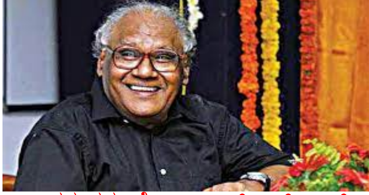
ಭಾರತ ರತ್ನ ಪ್ರೊ||ಸಿ.ಎನ್.ಆರ್.ರಾವ್ ವಿಜ್ಞಾನಿ (ಸಂಶೋಧಕರು).