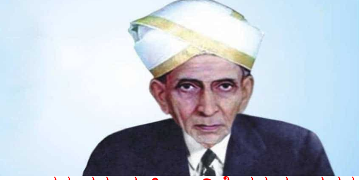
ಭಾರತ ರತ್ನ ಸರ್.ಎಂ.ವಿಶ್ವೇಶ್ವರಯ್ಯ ನವರು ಇಂಜಿನಿಯರ್.