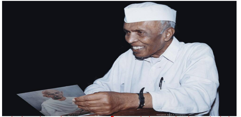
ಪದ್ಮ ಭೂಷಣ ಡಾ||ಹೆಚ್.ನರಸಿಂಹಯ್ಯ ನವರು ಶಿಕ್ಷಣ ತಜ್ಞರು.