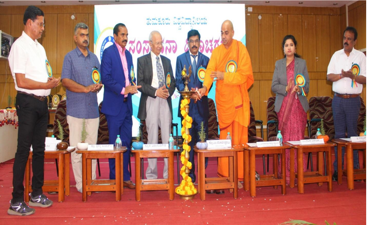
ವಿಶ್ವವಿದ್ಯಾನಿಲಯದ ಸಂಸ್ಥಾನಾ ದಿನಾಚರಣೆ