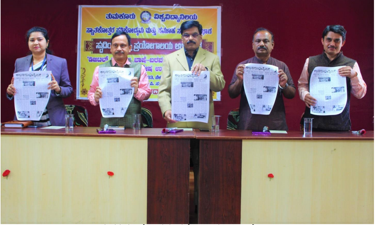
ನೂತನ ಸ್ವಡಿಯೋ ಮತ್ತು ಪ್ರಯೋಗಾಲಯ ಉದ್ಘಾಟನೆ