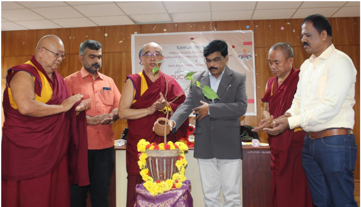
Special Lecture Programme in Collaboration with Sera Jey Monestic University