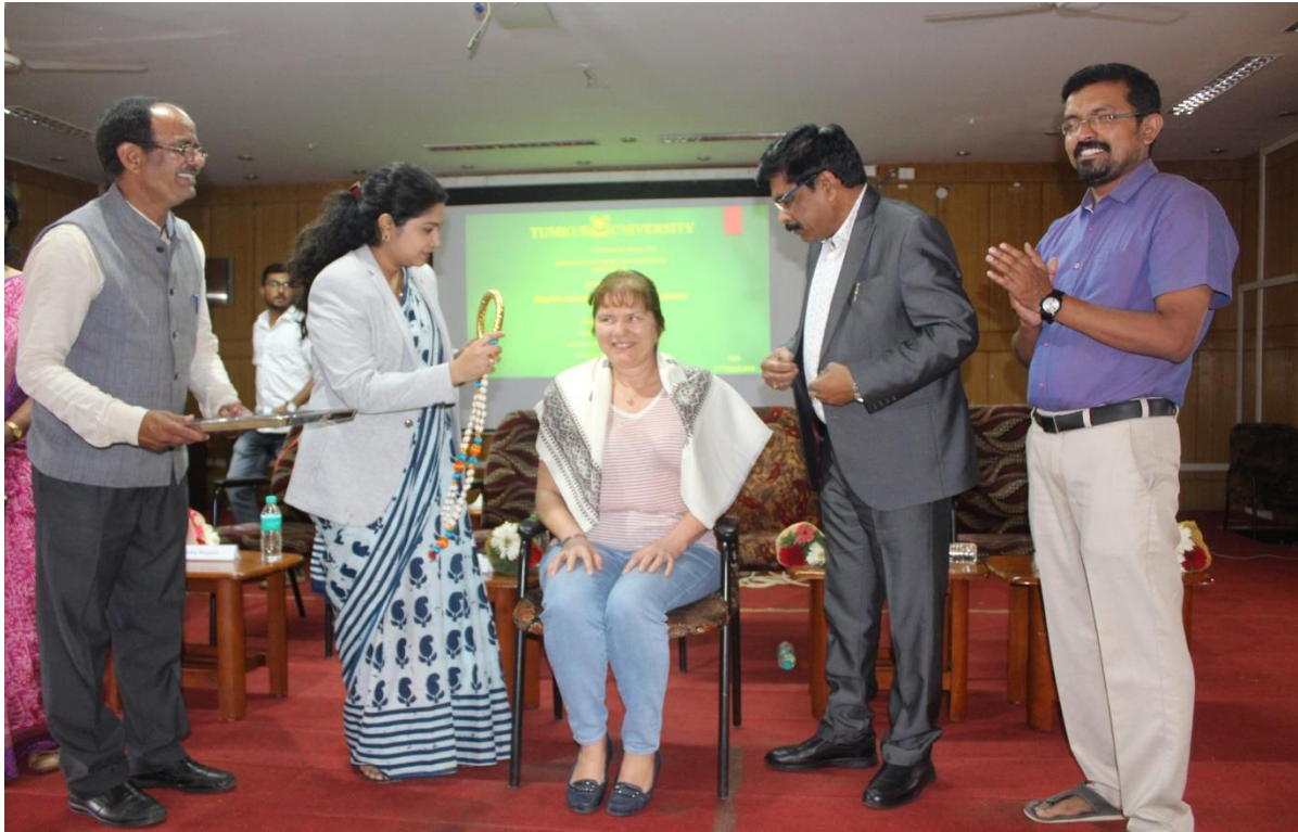
Special Lecture Programme on “Applications of Fluid Mechanics”