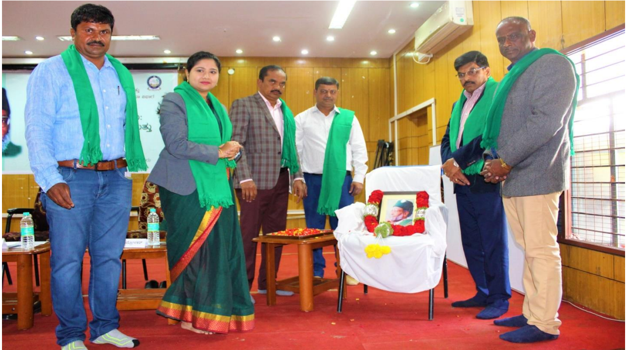
Special Lecture Programme by Prof. M.D. Nanjudaswamy Study Chair