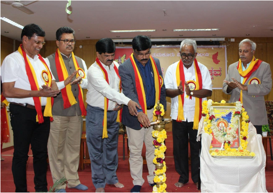
Celebration of 67 th Kannada Rajyotsava