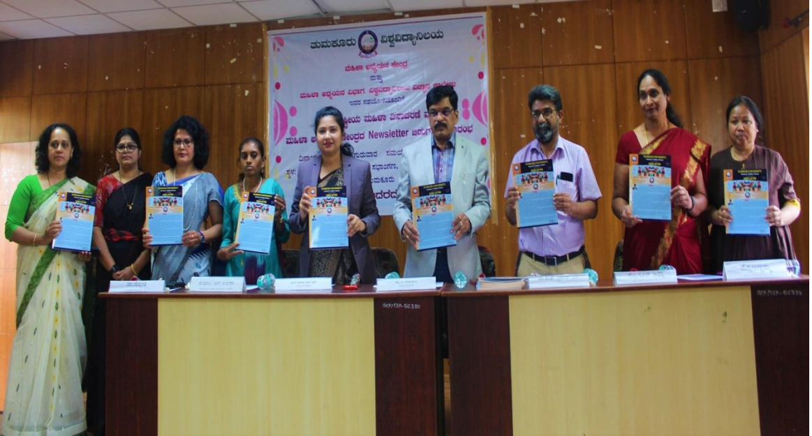
ಅಂತಾರಾಷ್ಟ್ರೀಯ ಮಹಿಳಾ ದಿನಾಚರಣೆ