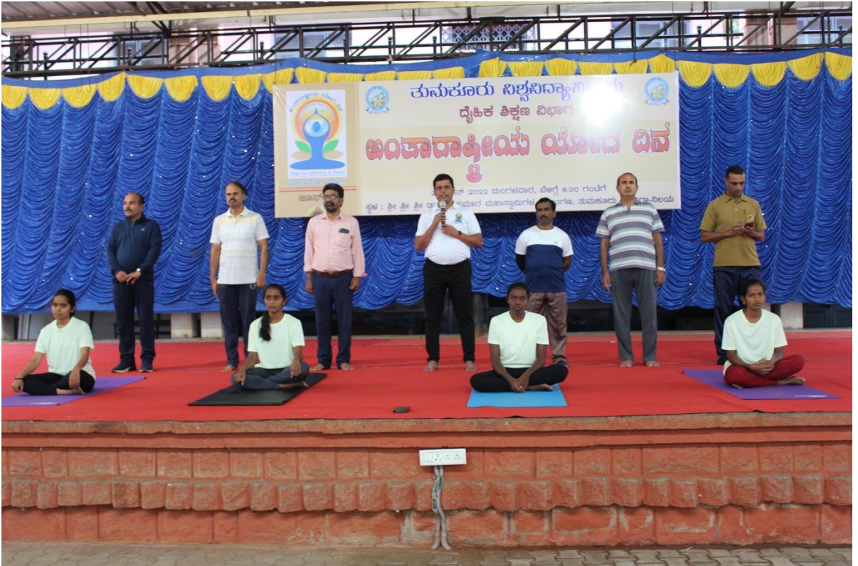
ಅಂತಾರಾಷ್ಟ್ರೀಯ ಯೋಗ ದಿನಾಚರಣೆ