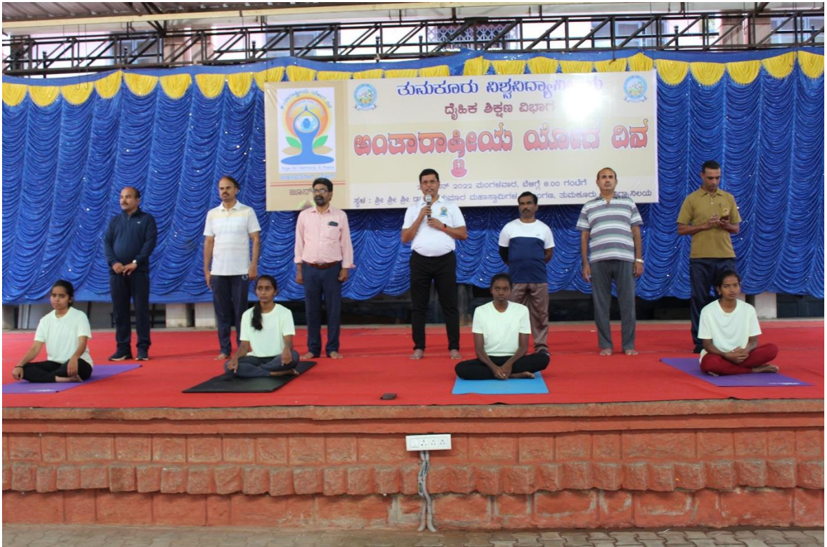
International Yoga Day Celebration