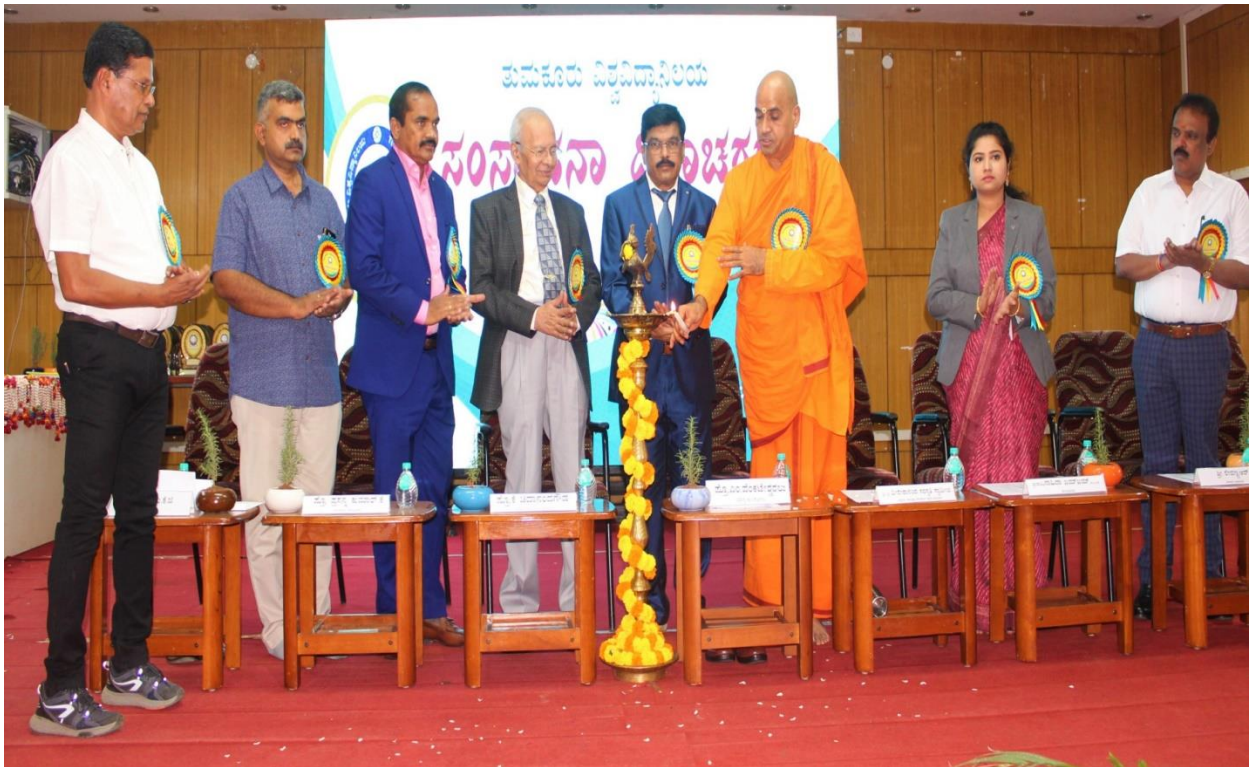
Celebration of University Foundation Day