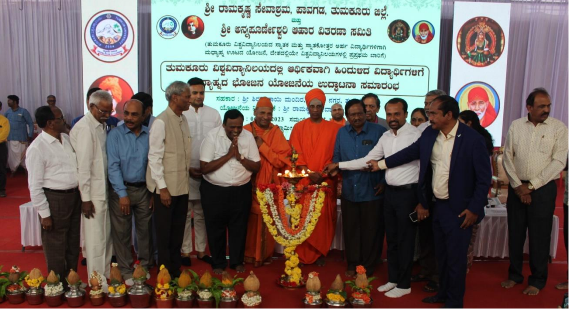
ಅನ್ನಪೂರ್ಣೋತ್ಥಲಿ ಮಧ್ಯಾಹ್ನದ ಭೋಜನ ಯೋಜನೆಯ ಉದ್ಘಾಟನೆ