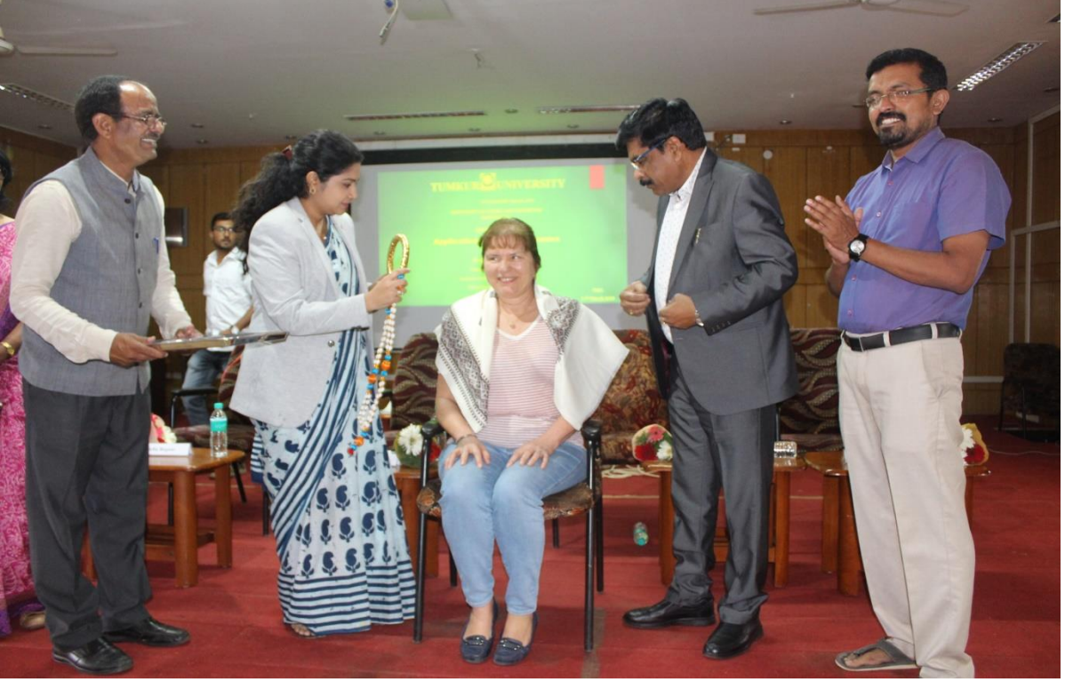
‘ಅಪ್ಲಿಕೇಷನ್ಸ್ ಆಫ್ ಫ್ಲೂಯಿಡ್ ಮೆಕಾನಿಕ್ಸ್’ ವಿಶೇಷ ಉಪನ್ಯಾಸ ಕಾರ್ಯಕ್ರಮ