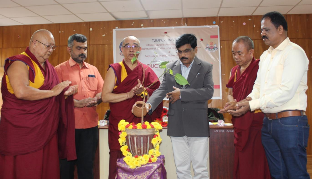
ಸೆರಾ ಜೆ ಮೊನಾಸ್ಟಿಕ್ ವಿಶ್ವವಿದ್ಯಾನಿಲಯ ಸಹಯೋಗದೊಂದಿಗೆ ವಿಶೇಷ ಉಪನ್ಯಾಸ ಕಾರ್ಯಕ್ರಮ