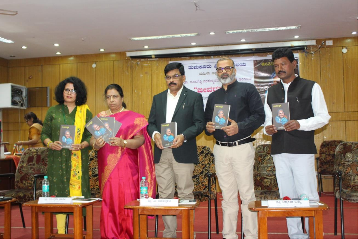
ಡಾ. ಸೂಲಗಿತ್ತಿ ನರಸಮ್ಮರವರ ಪುಣ್ಯಸ್ಥರಣೆ ಅಂಗವಾಗಿ “ಜೀವರಕ್ಷಕಿ” ಪುಸ್ತಕ ಬಿಡುಗಡೆ ಕಾರ್ಯಕ್ರಮ