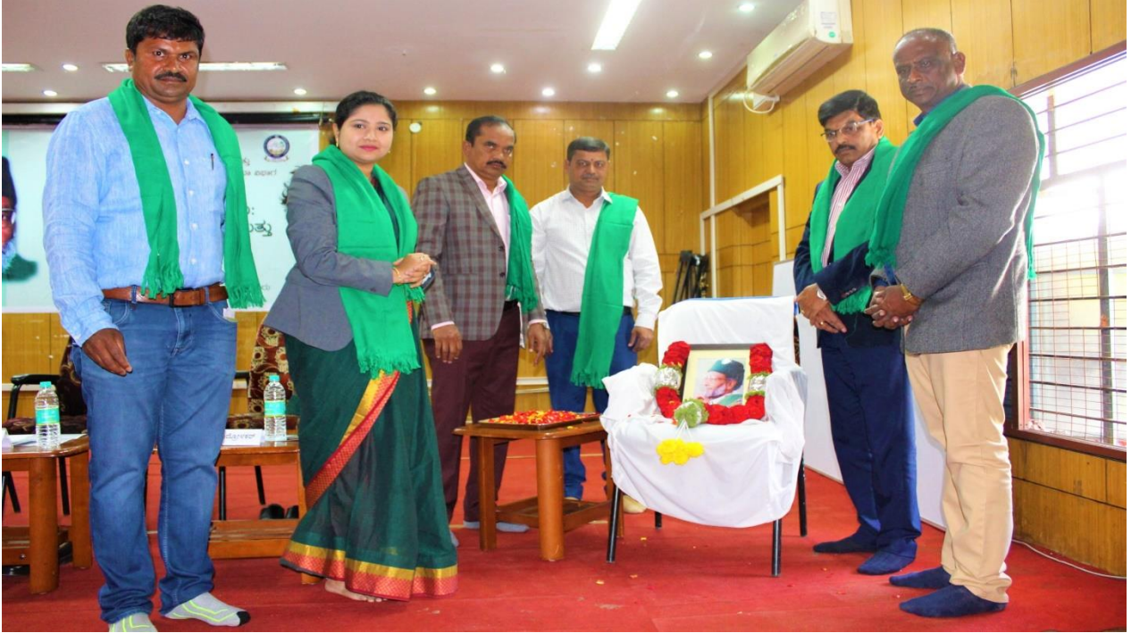
ಪ್ರೊ. ಎಂ. ಡಿ. ನಂಜುಂಡಸ್ವಾಮಿ ಅಧ್ಯಯನ ಪೀಠದಿಂದ ಆಯೋಜಿಸಲಾದ ವಿಶೇಷ ಉಪನ್ಯಾಸ ಕಾರ್ಯಕ್ರಮ