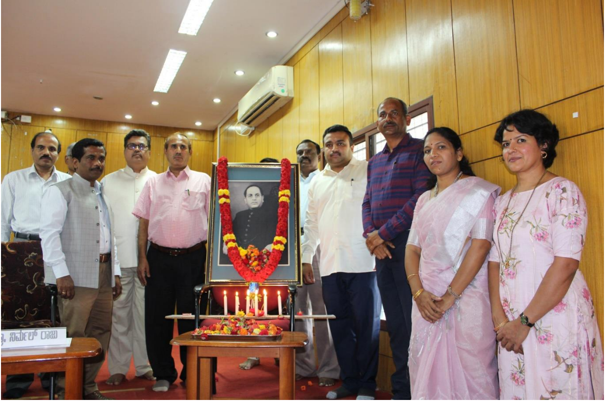
ಡಾ. ಬಿ.ಆರ್. ಅಂಬೇಡ್ಕರ್‌ರವರ ಜನ್ಮ ದಿನಾಚರಣೆ