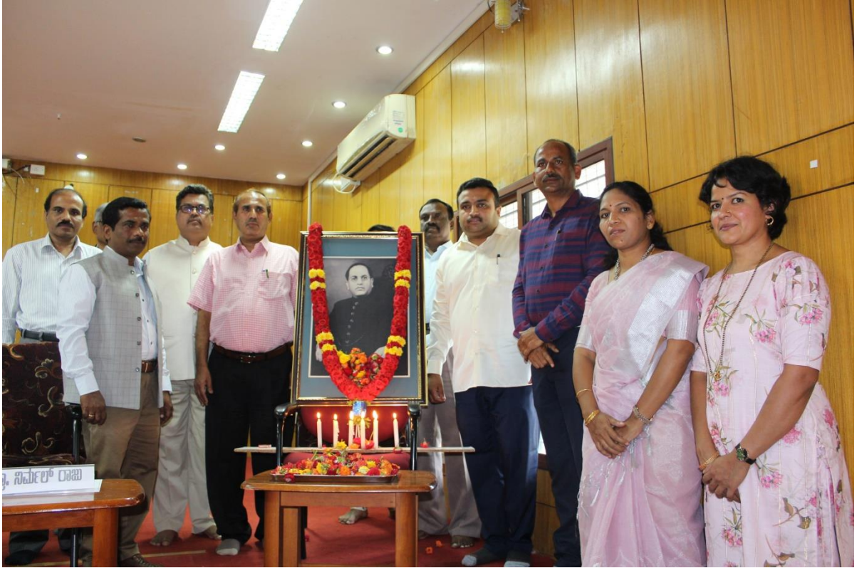
Dr. B.R. Ambedkar Birthday Celebration