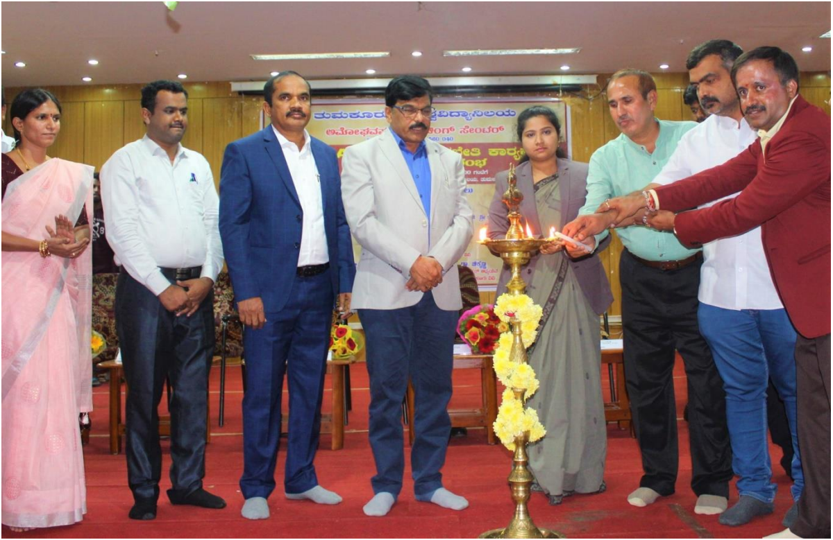
Free IAS/KAS Coaching Programme