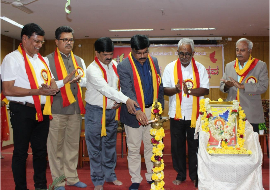
67ನೇ ಕನ್ನಡ ರಾಜ್ಯೋತ್ಸವ ಆಚರಣೆ