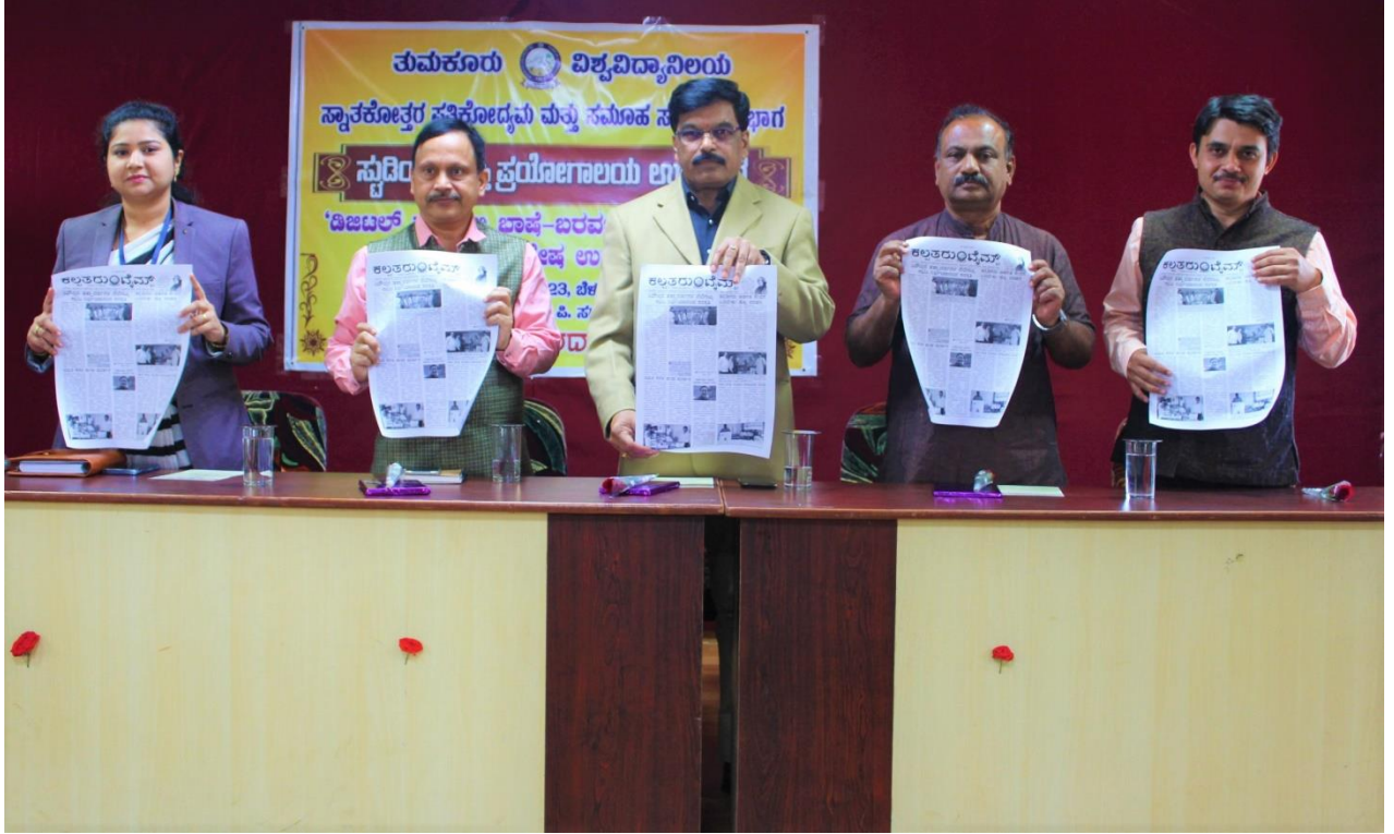
Inauguration of New Studio and Laboratory