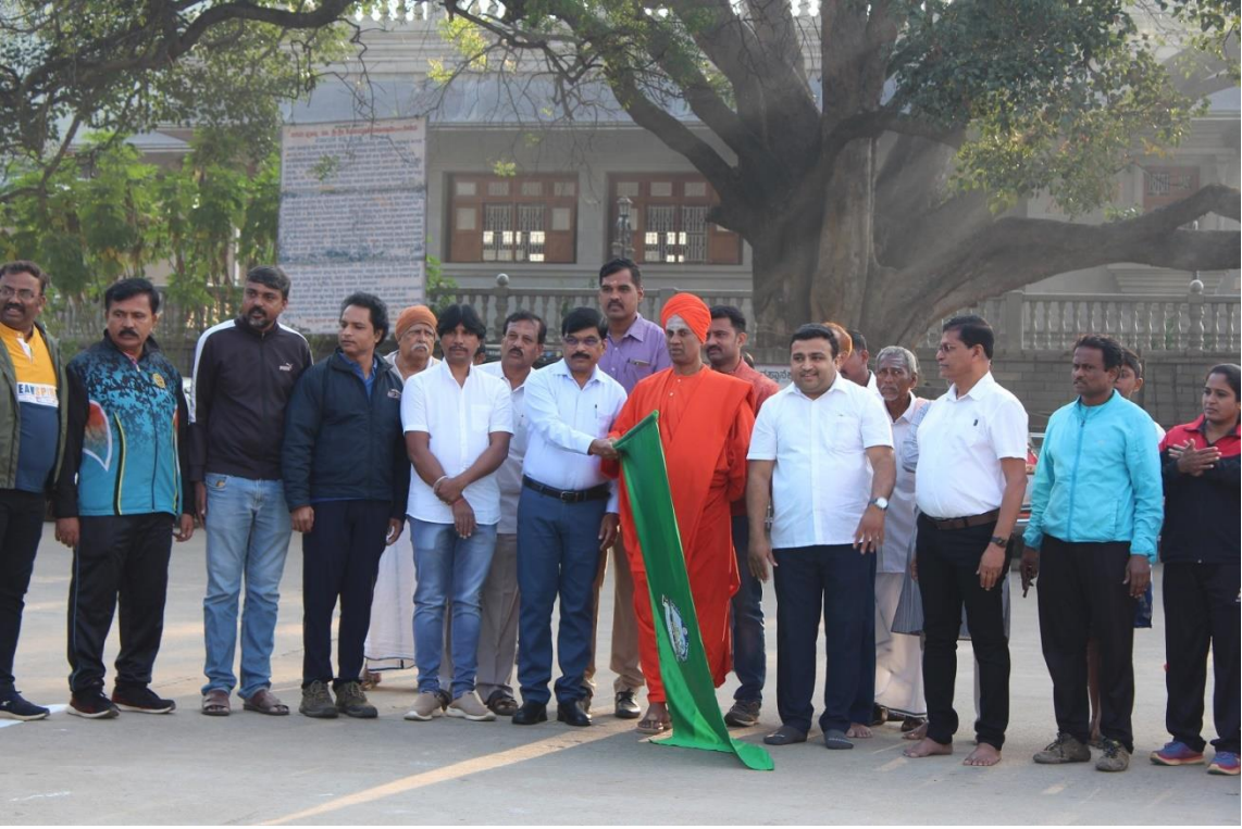
Inauguration of Inter Colleges Sports Events