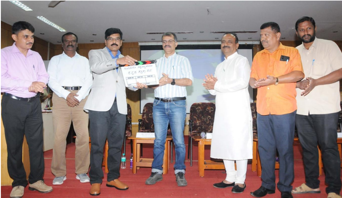
Kannada Patrika Dinacharane