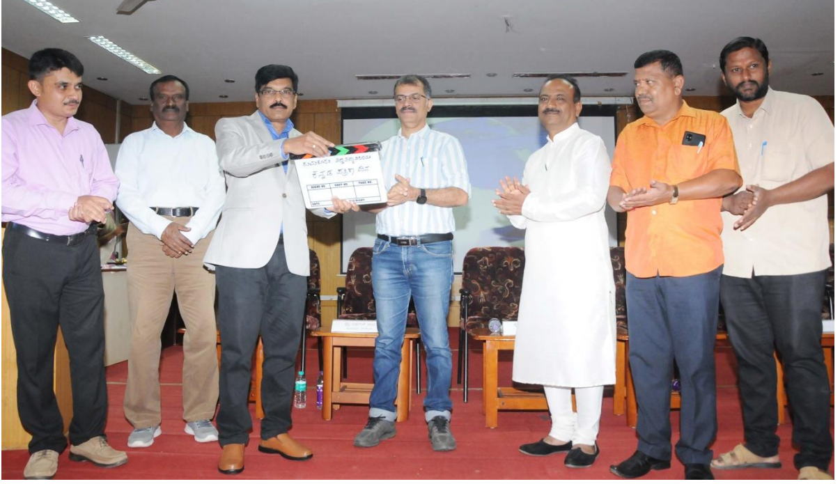
ಕನ್ನಡ ಪತ್ರಿಕಾ ದಿನಾಚರಣೆ