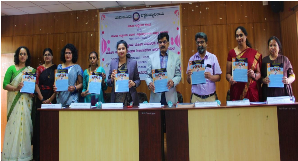
Celebration of International Women's Day