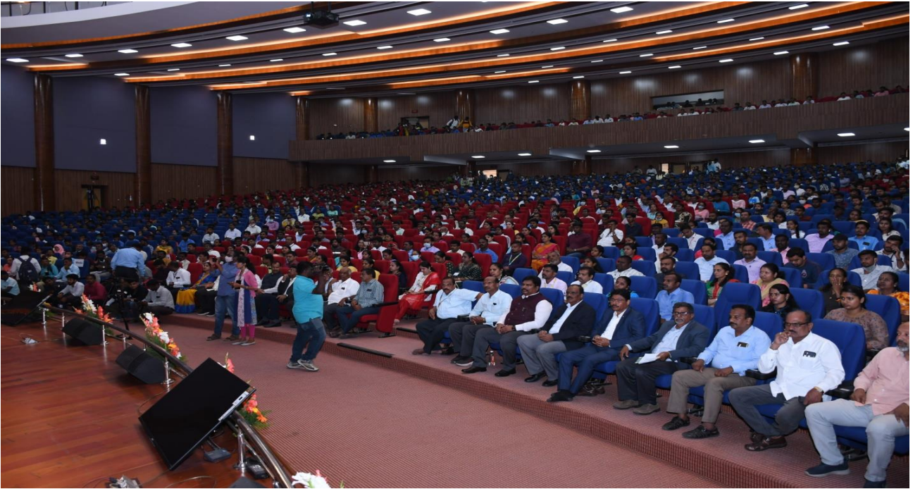
ಉದ್ಯೋಗ ಮೇಲೆ ಭಾಗವಹಿಸಿರುವ ವಿದ್ಯಾರ್ಥಿಗಳು