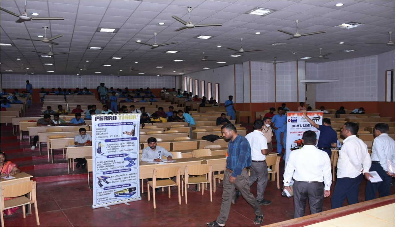
Apprenticeship Mela ಕಾರ್ಯಕ್ರಮದಲ್ಲಿ ಭಾಗಿಯಾದ ರಾಜ್ಯದ ಹೆಸರಾಂತ ಕಂಪನಿಗಳು.