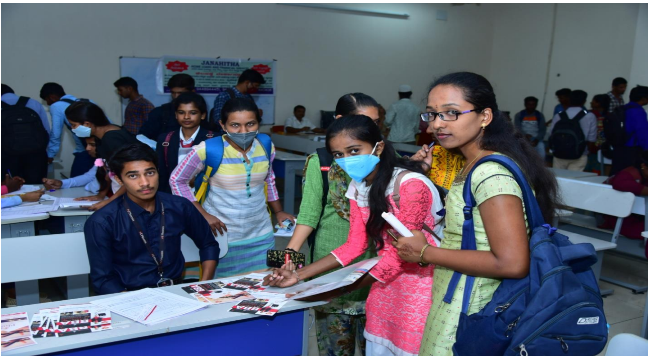
The Job Aspirants enrolled / registered their names with the respective companies/employer.