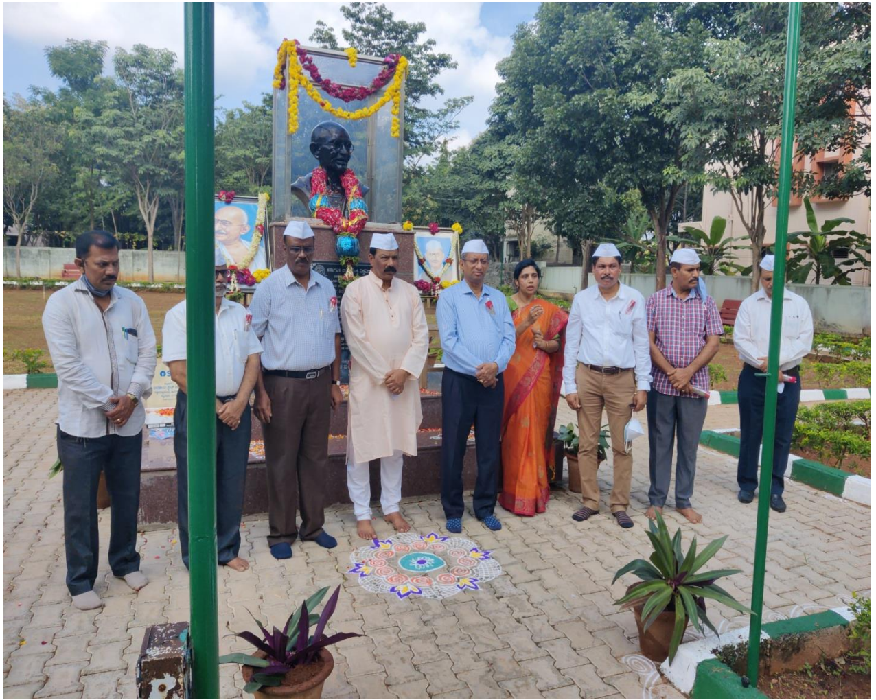
Officers of KSOU