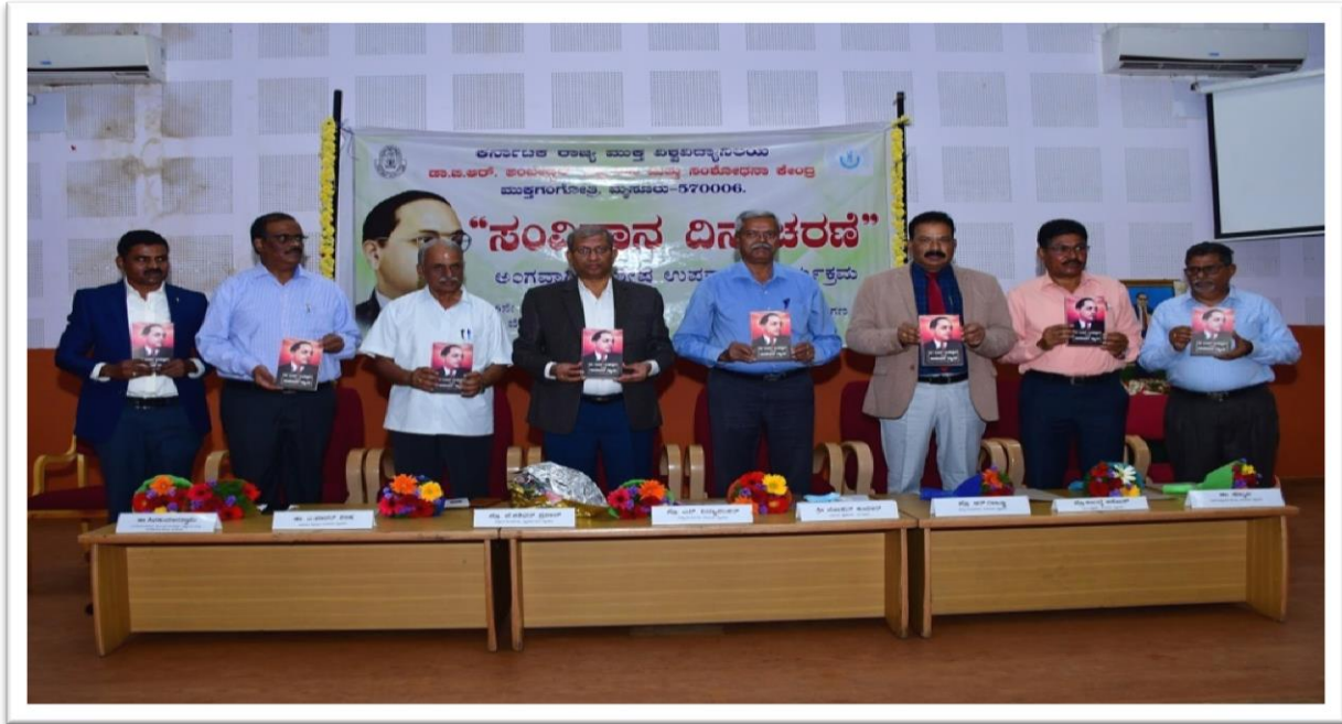
Dignitaries releasing the book “Dr. B R Ambedkar and Social Justice” on the eve of “Constitution Day”