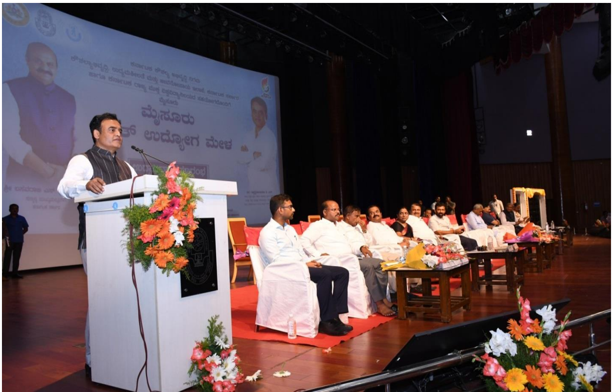
Chairman speech of Hon'ble Minister of Higher Education C.N Ashwath Narayan.