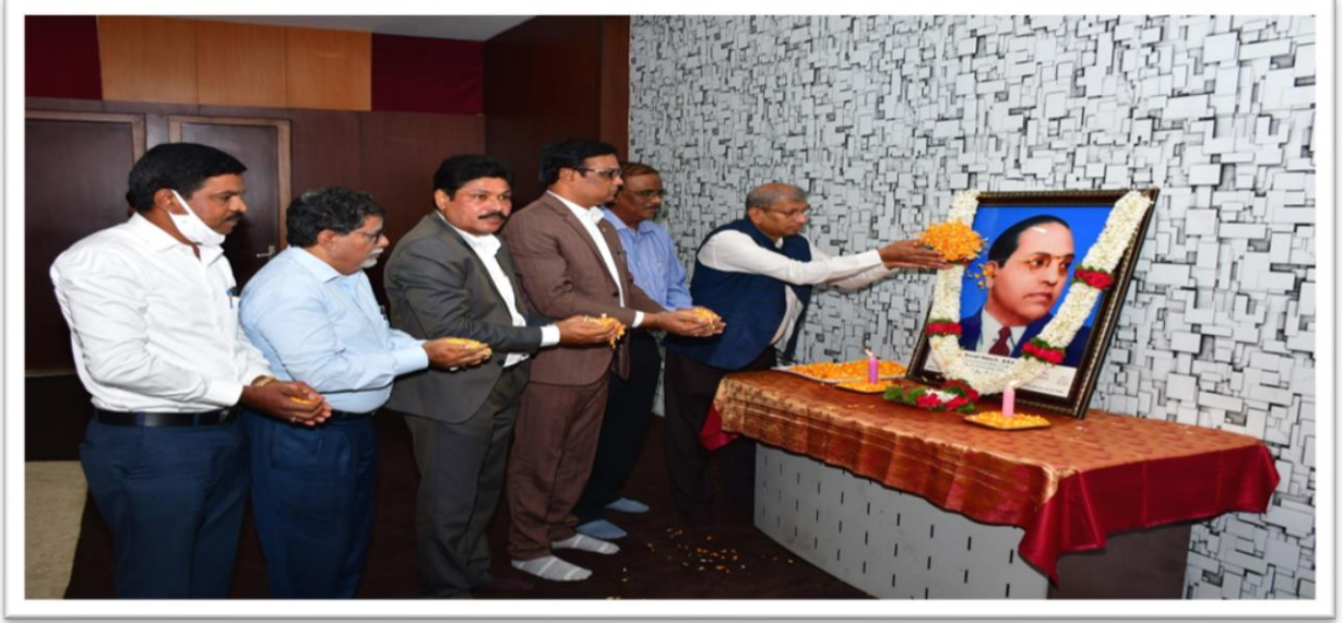
“ಸಂವಿಧಾನ ಶಿಲ್ಪಿ ಡಾ.ಬಿ.ಆರ್.ಅಂಬೇಡ್ಕರ್‌ರವರ 130ನೇ ಜನ್ಮ ದಿನಾಚರಣೆ” ಕಾರ್ಯಕ್ರಮದ ಅಂಗವಾಗಿ ಬಾಬಾ ಸಾಹೇಬಲಿಗೆ ಮಾನ್ಯ ಕುಲಪತಿಗಳು ಹಾಗೂ ವಿ.ವಿ.ಯು ಶಾಸನಬದ್ಧ ಅಧಿಕಾರಿಗಳಿಂದ ಪುಷ್ಕರ್ಜಾನೆ