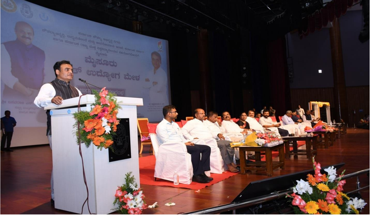
ಮಾನ್ಯ ಉನ್ನತ ಶಿಕ್ಷಣ ಸಚಿವರಾದ ಡಾ.ಅಶ್ವತ್ಥ ನಾರಾಯಣ ಅವರು ಉದ್ಘಾಟನಾ ಭಾಷಣ ಮಾಡುತ್ತಿರುವುದು.