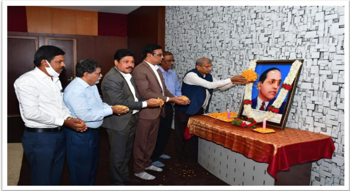
Floral Offerings to the Portrait of Dr. B.R.Ambedkar by the Hon'ble Vice Chancellor and the Statutory Officers of the University on the occasion of the 130 th Birth Anniversary of the Architect of the Indian Constitution Dr. B.R.Ambedkar.