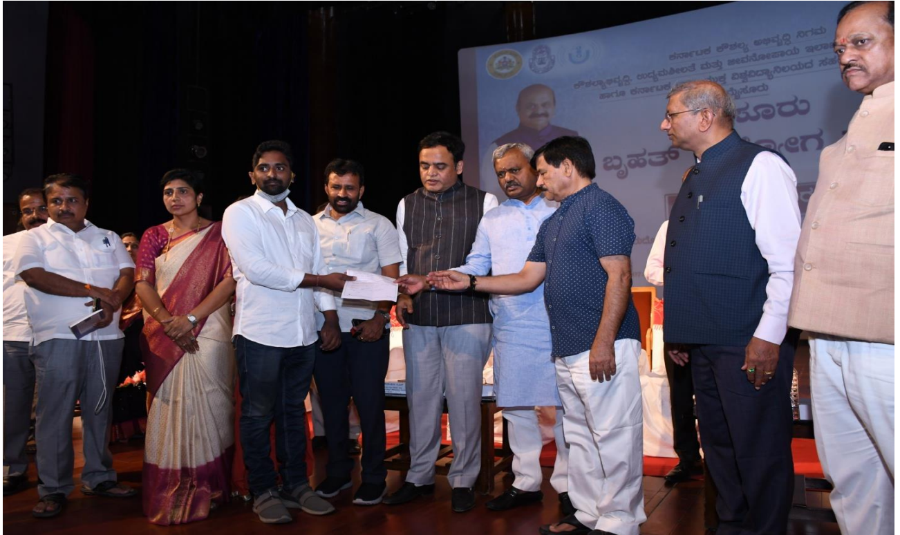
The dignitaries giving employment offer letters to Selected students