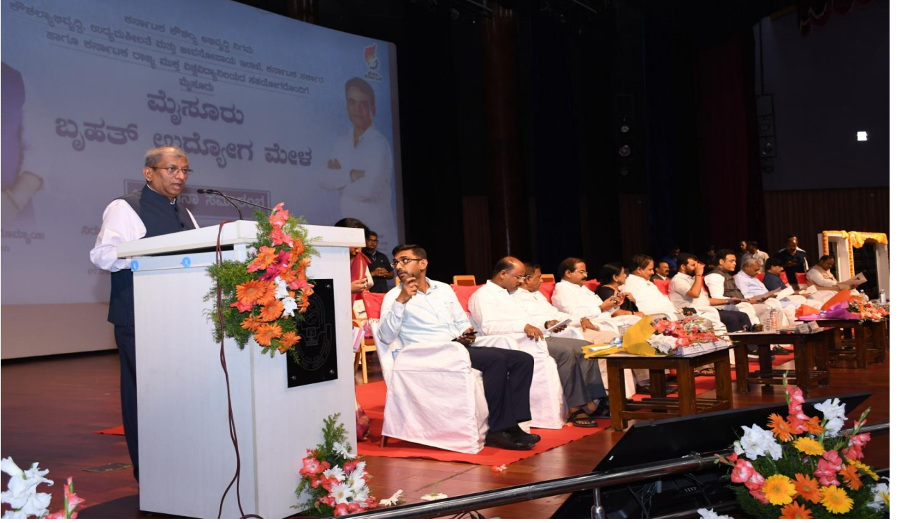
ಮಾನ್ಯ ಕುಲಪತಿಗಳು ಕಾರ್ಯಕ್ರಮ ಕುರಿತು ಮಾಡುತ್ತಿರುವುದು.