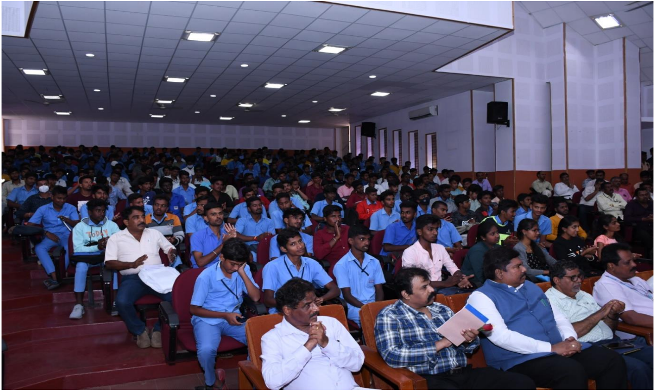
ITI holders in Apprenticeship Mela drive