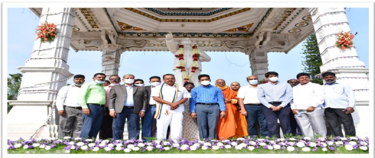
On the eve of Dr. B. R Ambedkar’s 65 th Parinibbana Day, The District Administration had organised a programme at the Town Hall of Mysuru on 06-12-2021. Hon’ble Vice-Chancellor garlanded the statue of Dr. B R Ambedkar. Registrar, Finance Officer and the Coordinator of the Centre participated in the programme