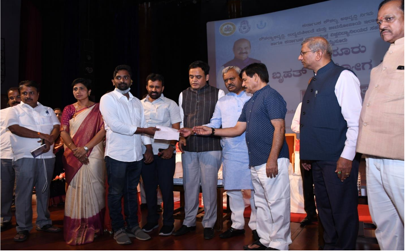
ಉದ್ಯೋಗಾರ್ಥಿಗಳಿಗೆ ಗಣ್ಯರುಗಳು ಉದ್ಯೋಗ ಪತ್ರ ನೀಡುತ್ತಿರುವುದು