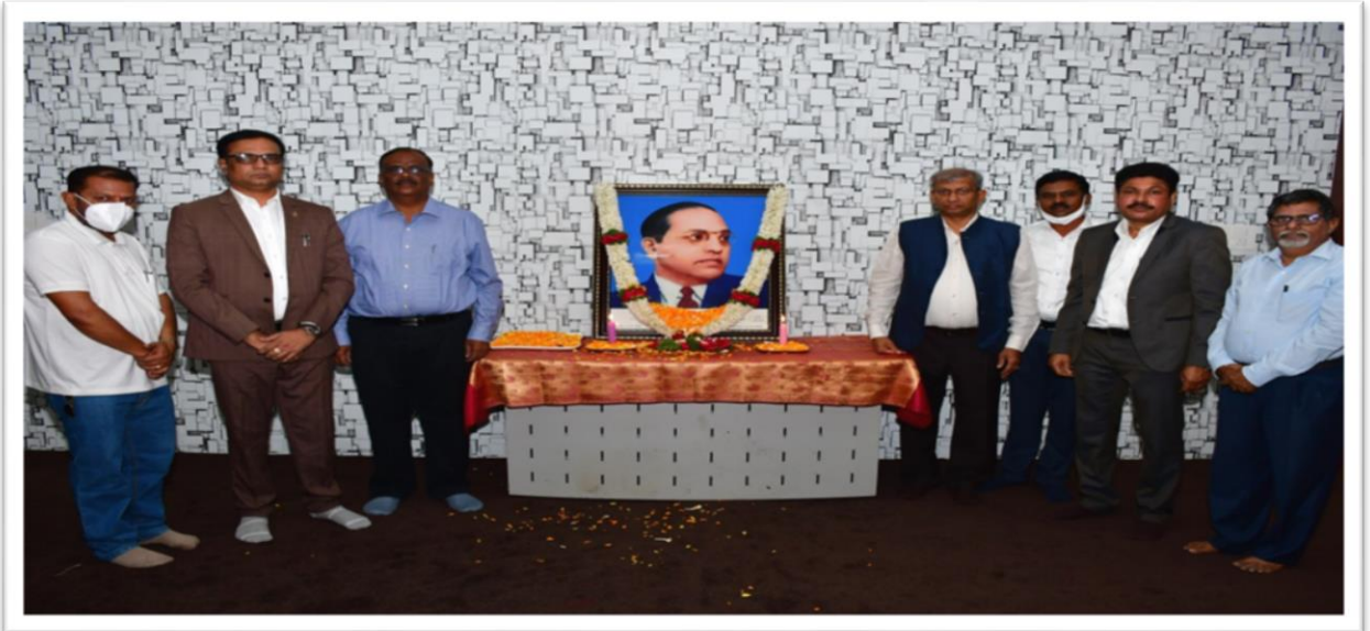
“ಸಂವಿಧಾನ ಶಿಲ್ಪಿ ಡಾ.ಬಿ.ಆರ್.ಅಂಬೇಡ್ಕರ್‌ರವರ 130ನೇ ಜನ್ಮ ದಿನಾಚರಣೆ” ಕಾರ್ಯಕ್ರಮದ ಅಂಗವಾಗಿ ಮಾನ್ಯ ಕುಲಪತಿಗಳು ಹಾಗೂ ವಿ.ವಿ.ಯು ಶಾಸನಬದ್ಧ ಅಧಿಕಾರಿಗಳು ಹಾಗೂ ಕೇಂದ್ರದ ಸಂಯೋಜನಾಧಿಕಾರಿ