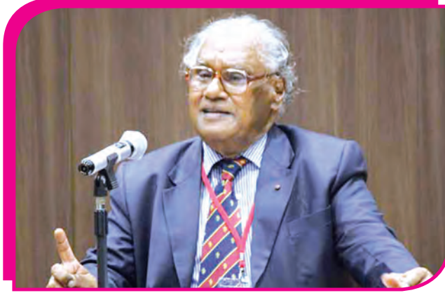
ಭಾರತ ರತ್ನ ಪ್ರೊ|| ಸಿ.ಎನ್.ಆರ್. ರಾವ್ ವಿಜ್ಞಾನಿ (ಸಂಶೋಧಕರು)