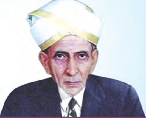
ಭಾರತ ರತ್ನ ಸರ್.ಎಂ. ವಿಶ್ವೇಶ್ವರಯ್ಯ ನವರು ಇಂಜಿನಿಯರ್