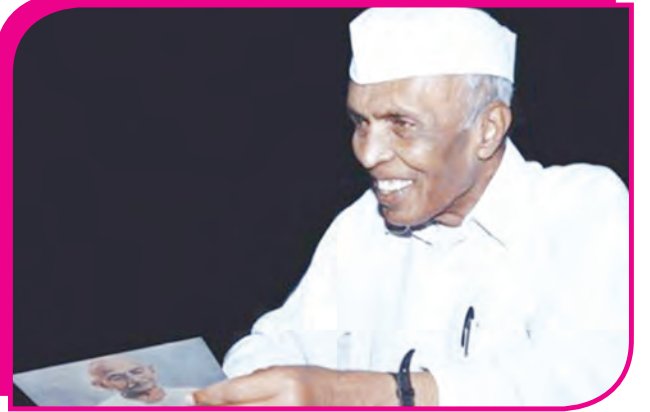
ಪದ್ಮಭೂಷಣ ಡಾ|| ಹೆಚ್. ನರಸಿಂಹಯ್ಯ ನವರು ಶಿಕ್ಷಣ ತಜ್ಞರು