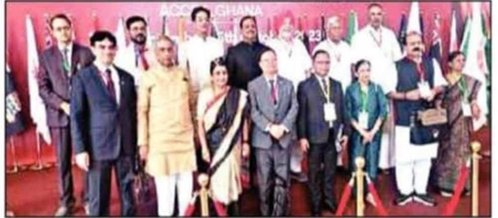
ಪಶ್ಚಿಮ ಆಫ್ರಿಕಾದ ಫಾಣಾ ರಾಜಧಾನಿಯ ಆಕ್ರಾದಲ್ಲಿ ಆಯೋಜಿಸಿದ್ದ '66ನೇ ಕಾಮನ್‌ವೆಲ್ತ್ ಪಾರ್ಲಿಮೆಂಟ್' ಸಮ್ಮೇಳನದಲ್ಲಿ ವಿಧಾನ ಪರಿಷತ್ ಸಭಾಪತಿ ಬಸವರಾಜ ಹೊರಟ್ಟ ಪಾಲ್ಗೊಂಡಿದ್ದರು.

ಪರಿಸರ ನಮಗೆ ಏನೆಲ್ಲ ಕೊಟ್ಟಿದೆ. ಅದನ್ನು ಕಾಪಾಡಿಕೊಂಡು ಹೋಗುವುದೆಂದೇ ನಮ್ಮ ಹೋಣೆಗಾರಿಕೆ. ಆ ನಿಟ್ಟಿನಲ್ಲಿ ಗಂಭೀರವಾಗಿ ಆಲೋಚಿಸಬೇಕಾಗಿದೆ ಎಂದು ತಿಳಿಸಿದರು.