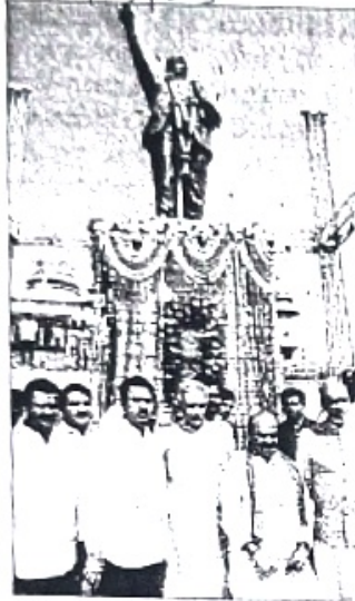
ಬೆಳಗಾವಿಯ ಸುವರ್ಣ ವಿಧಾನಸೌಧದ ವಕ್ರಮಾಪ್ತ ದ್ವಾರದ ಮುಂಭಾಗದ ಆವರಣದಲ್ಲಿ ಹಾ.ಬಿ.ಆರ್.ಅಂಬೇಡ್ಕರ್, ಕಿತ್ತೂರು ಚಿನ್ನಮ್ಮ ಹಾಗೂ ಸಂಗೊಳ್ಳಿ ರಾಯಣ್ಣನವರ ಪ್ರತಿಮೆಗಳನ್ನು ಸಿಎಂ ಬೊಮ್ಮಾಯಿ ಅನಾವರಣಗೊಳಿಸಿದರು.

ಬೆಳಗಾವಿಯ ಸುವರ್ಣ ವಿಧಾನಸೌಧದ ವಕ್ರಮಾಪ್ತ ಮುಂಭಾಗದ ಆವರಣದಲ್ಲಿ ಮೂರೂ ಪ್ರತಿಮೆ ಗಳನ್ನು ಅನಾವರಣಗೊಳಿಸಿ ಮಾಡಲಾಗಿದೆ. ಬೆಳಗಾವಿ ಕರ್ನಾಟಕದ ಕಿರೀಟ. ಬೆಳಗಾವಿಯ ಕಿರೀಟ ಸುವರ್ಣ ಸೌಧ. ಕರ್ನಾಟಕದಲ್ಲಿ ಅತೀ ಹೆಚ್ಚು ವ್ಯಾಕೃತ ಹೋರಾಟಗಾರರು ಇರುವುದು ಕೂಡ ಬೆಳಗಾವಿ ಜಿಲ್ಲೆಯಲ್ಲೇ. ಇಂತಹ ಪರಂಪರೆ ಇರುವಂತಹ ಜಿಲ್ಲೆಯ ಜನರಿಗೆ ಸದಾ ಸ್ಫೂರ್ತಿಯಾಗಿ ನಿಲ್ಲಲು ಈ ಪ್ರತಿಮೆಗಳನ್ನು ಇಲ್ಲಿ ಸ್ಥಾಪನೆ ಮಾಡಲಾಗಿದೆ. ಮಹಾತ್ಮ ಗಾಂಧೀಜಿಯವರ ಪ್ರತಿಮೆ ದೊಡ್ಡದಿರುವ ಕಾರಣಕ್ಕೆ ಅನಾವರಣ ಕಡೆವಾಗಿದ್ದು ಇನ್ನೂ ಎರಡು ಮೂರು ತಿಂಗಳಲ್ಲಿ