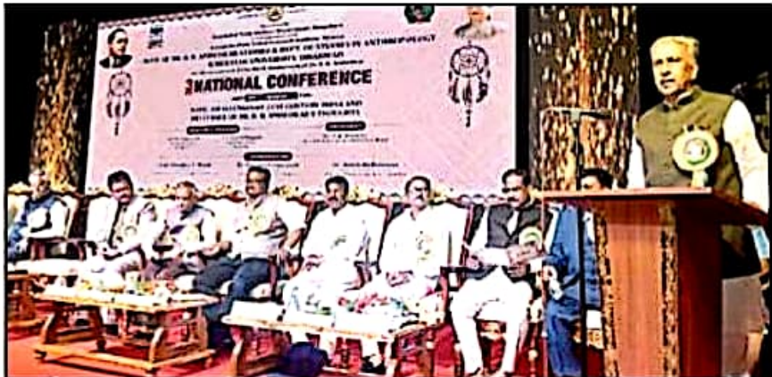
ಡಾ. ಬಿ.ಆರ್. ಅಂಬೇಡ್ಕರ್ ಅವರ 131ನೇ ಜನ್ಮ ದಿನದ ಅಂಗವಾಗಿ ಕರ್ನಾಟಕ ವಿಶ್ವವಿದ್ಯಾಲಯ ಆವರಣದ ಸುವರ್ಣ ಮಹೋತ್ಸವ ಸಭಾಂಗಣದಲ್ಲಿ ಹಮ್ಮಿಕೊಂಡಿದ್ದ ಮೂರು ದಿನಗಳ ರಾಷ್ಟ್ರೀಯ ಸಮ್ಮೇಳನವನ್ನು ವಿಧಾನ ಪರಿಷತ್ ಸಭಾಪತಿ ಬಸವರಾಜ ಹೊರಟ್ಟ ಉದ್ಘಾಟಿಸಿ ಮಾತನಾಡಿದರು.

ಅಂಬೇಡ್ಕರ್ ಅವರು ಆಂದಿನ ಕಾಲದಲ್ಲಿ ಹಲವು ಸಂಕಷ್ಟಗಳನ್ನು ಎದುರಿಸಿ ಶಿಕ್ಷಣ ಪಡೆದು ನಮ್ಮ ದೇಶಕ್ಕೆ ಸಂವಿಧಾನ ರಚಿಸುವ ಮೂಲಕ ಎಲ್ಲ ಸಂಕೋಲೆಗಳಿಂದ ಮುಕ್ತಿ ನೀಡಿದವರು ಅಂಬೇಡ್ಕರ್. ಈ ಹಿಂದೆ ತಳ ಸಮುದಾಯದವರು ಅನುಭವಿಸಿದ ಕಷ್ಟಗಳನ್ನು ಯುವ ಸಮುದಾಯ ಓದುವ ಮೂಲಕ ತಿಳಿದುಕೊಳ್ಳಬೇಕು. ಹಿಂದಿನ ಪೀಳಿಗೆಗಳು ಅನುಭವಿಸಿದ ಕಷ್ಟ ಹಾಗೂ ಹೋರಾಟಗಳನ್ನು