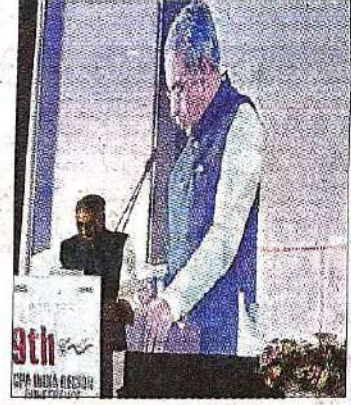
ರಾಜಸ್ಥಾನ ಉದಯಪುರದಲ್ಲಿ ನಡೆದ 9ನೇ ಕಾಮನ್‌ವೆಲ್ತ್ ಸಂಸದೀಯ ಸಂಘದ ಭಾರತ ವಲಯದ ಸಮ್ಮೇಳನದಲ್ಲಿ ಕರ್ನಾಟಕ ವಿಧಾನ ಪರಿಷತ್ ಸಭಾಪತಿ ಬಸವರಾಜ ಹೊರಟ್ಟ ಮಾತನಾಡಿದರು.