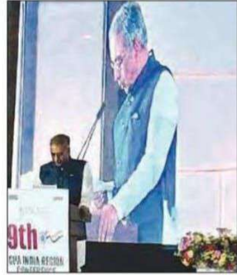
ರಾಜಸ್ಥಾನ ಉದಯಪುರದಲ್ಲಿ ನಡೆದ 9ನೇ ಕಾಮನ್‌ವೆಲ್ತ್ ಸಂಸದೀಯ ಸಂಘದ ಭಾರತ ವಲಯದ ಸಮ್ಮೇಳನದಲ್ಲಿ ಕರ್ನಾಟಕ ವಿಧಾನ ಪರಿಷತ್ ಸಭಾಪತಿ ಬಸವರಾಜ ಹೊರಟ್ಟ ಮಾತನಾಡಿದರು.